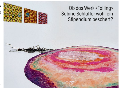
Ob das Werk «Falling» Sabine Schlatter wohl ein Stipendium beschert?

Div. Führungen/Veranstaltungen/Konzerte: siehe Website