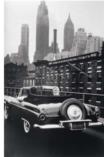
Sam Shaw, Marilyn Monroe und Henry Miller im Auto, New York City, 1957, 50 x 33 cm, Silbergelatine Print auf Baryt