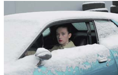
Claudia Imbert, Le Garage, 2012, 40 x 50 cm / Video HD 2 Minuten und C-Print