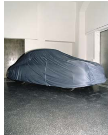
Axel Martens, Der erste Porsche 1, Baujahr 1950, 2009