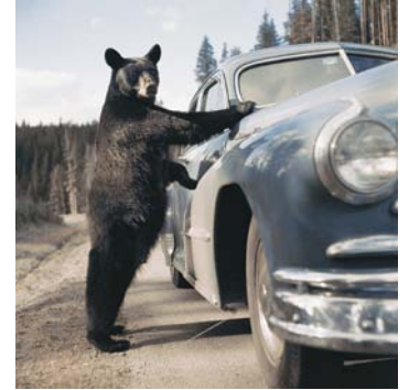
Emil Schulthess, Yellowstone-Nationalpark, Wyoming, USA, 1953, © Fotostiftung Schweiz