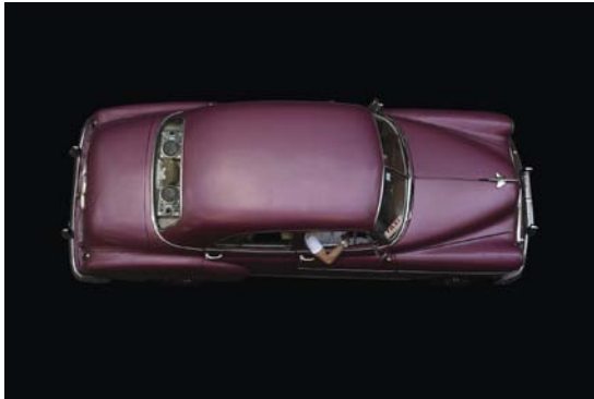
alle Abbildungen auf dieser Seite von Thomas Meinicke, aus „Havana Cabs“