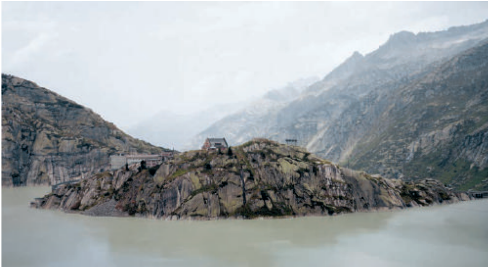
msel Hospiz, Schweiz, 2004.

Ausstellung: bis 30. August in der Bildhalle, Seestrasse 16, Kilchberg