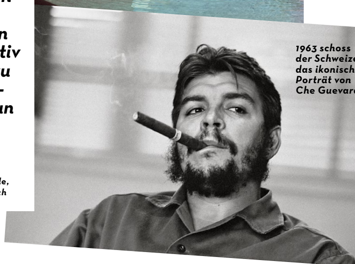
1963 schoss der Schweizer das ikonische Porträt von Che Guevara.