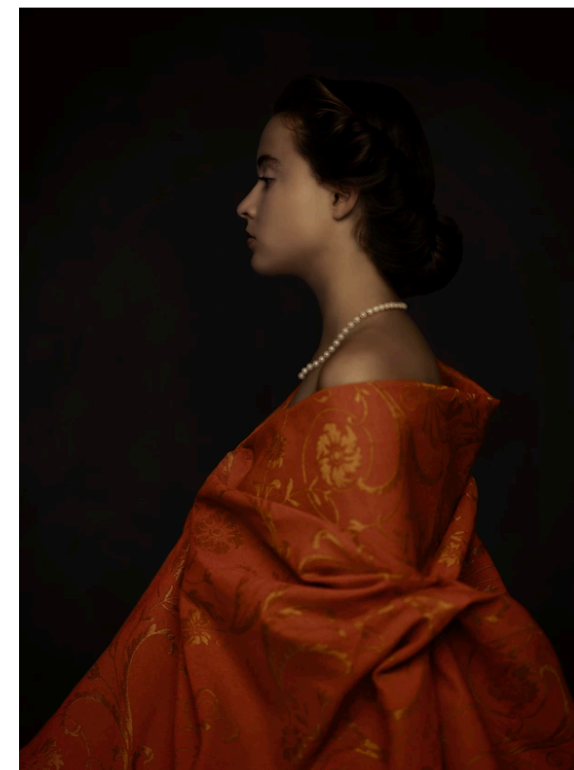
Subdued splendor #2, 2022.