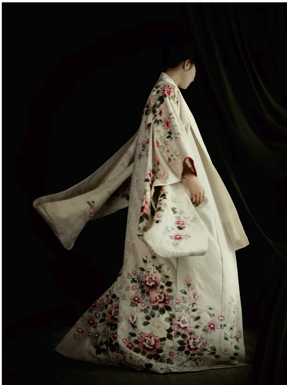
Unseen memories, 2022.

Fotograaf Ilona Langbroek doorbreekt het zwijgen van haar Indische familie: 'Dit is het verhaal van zoveel Nederlanders'