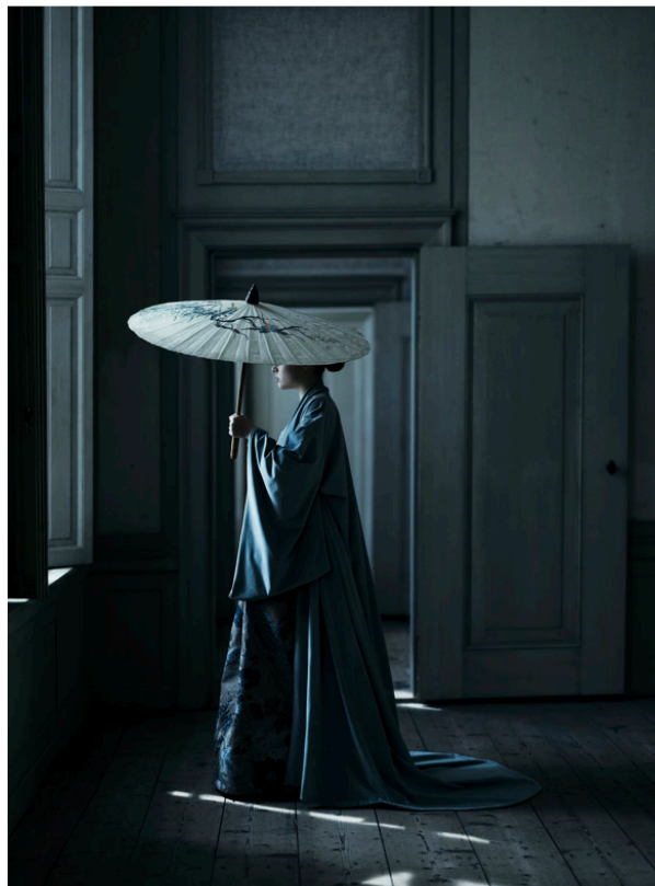
Longing for Insulinde, 2021.

Behalve stilistisch bracht de bezinningsperiode de fotograaf ook inhoudelijk dichterbij zichzelf. Hoe moeizaam dat in het begin ook liep, ze ging gesprekken aan met ooms en tantes. Ze betrok haar moeder bij haar werk door haar kostuums te laten naaien. Een aantal familieleden is uit hun schulp gekropen, maar ze zullen nog steeds niet op een verjaardagsfeestje openlijk het verleden aansnijden. Dat vindt Langbroek ook niet erg. Het gaat haar niet om het één-op-één vertellen wat haar naasten hebben doorgemaakt.