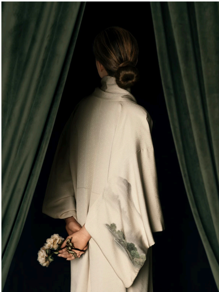
Memories, 2023.

Een vergelijkbare bloem keert terug in de foto ernaast, tussen de vingers van een jonge vrouw. Ze is een van Langbroeks vier vaste modellen. “Ze hebben allemaal een Indische achtergrond en ik ken ze via vrienden en familie. Ik wilde geen professionele modellen, dan lijkt het snel een modeshoot.”