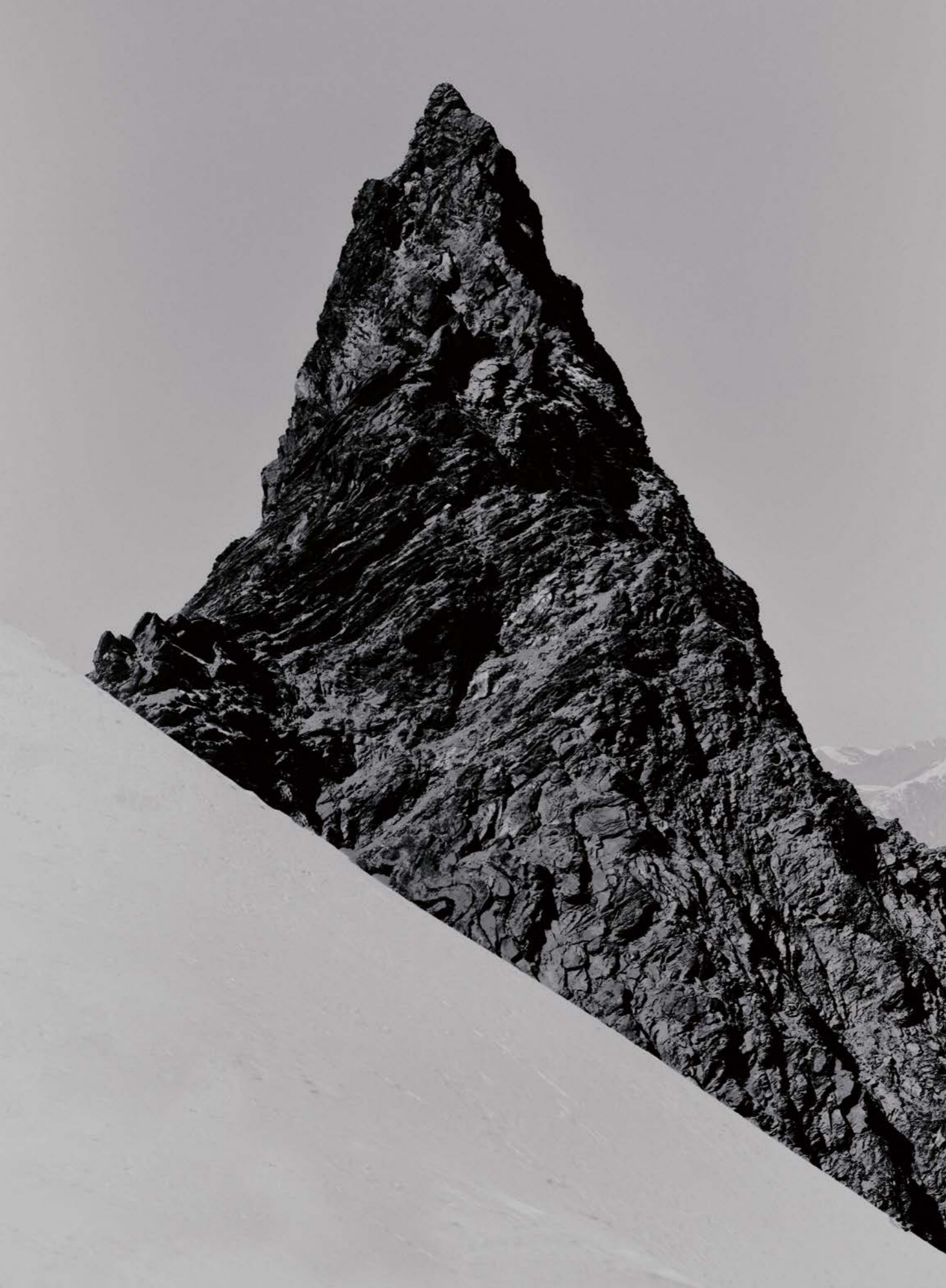
Peak, «Peak», 2019 by Bastiaan Woudt