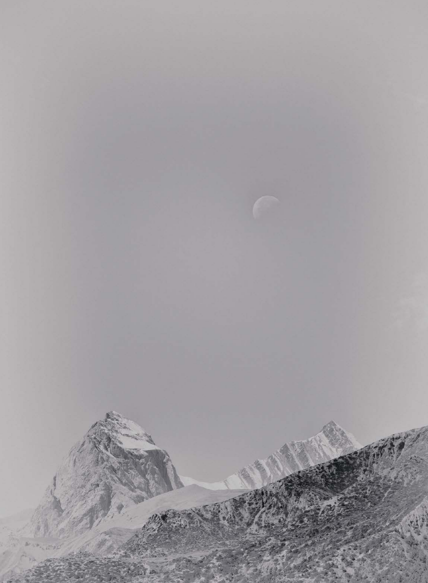
Moon over Tilicho, «Peak», 2019

schaffen. Und eine Mütze natürlich, weil viel Wärme über den Kopf verloren geht.