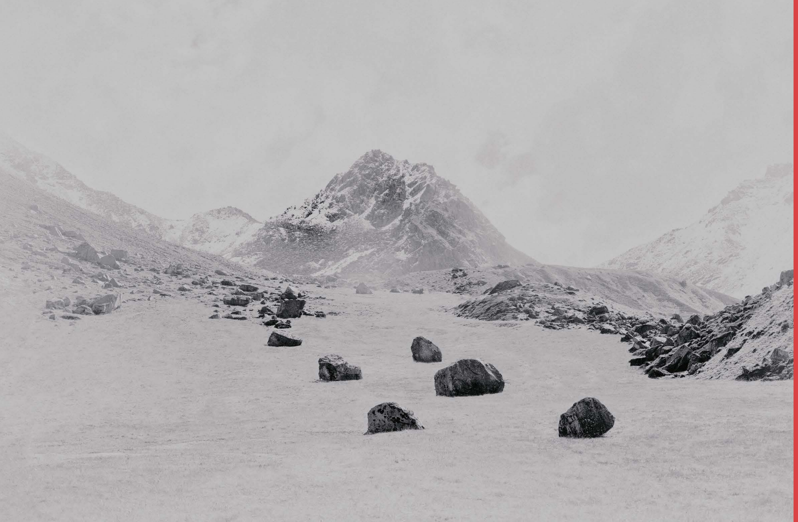
Rock Valley, «Peak», 2019