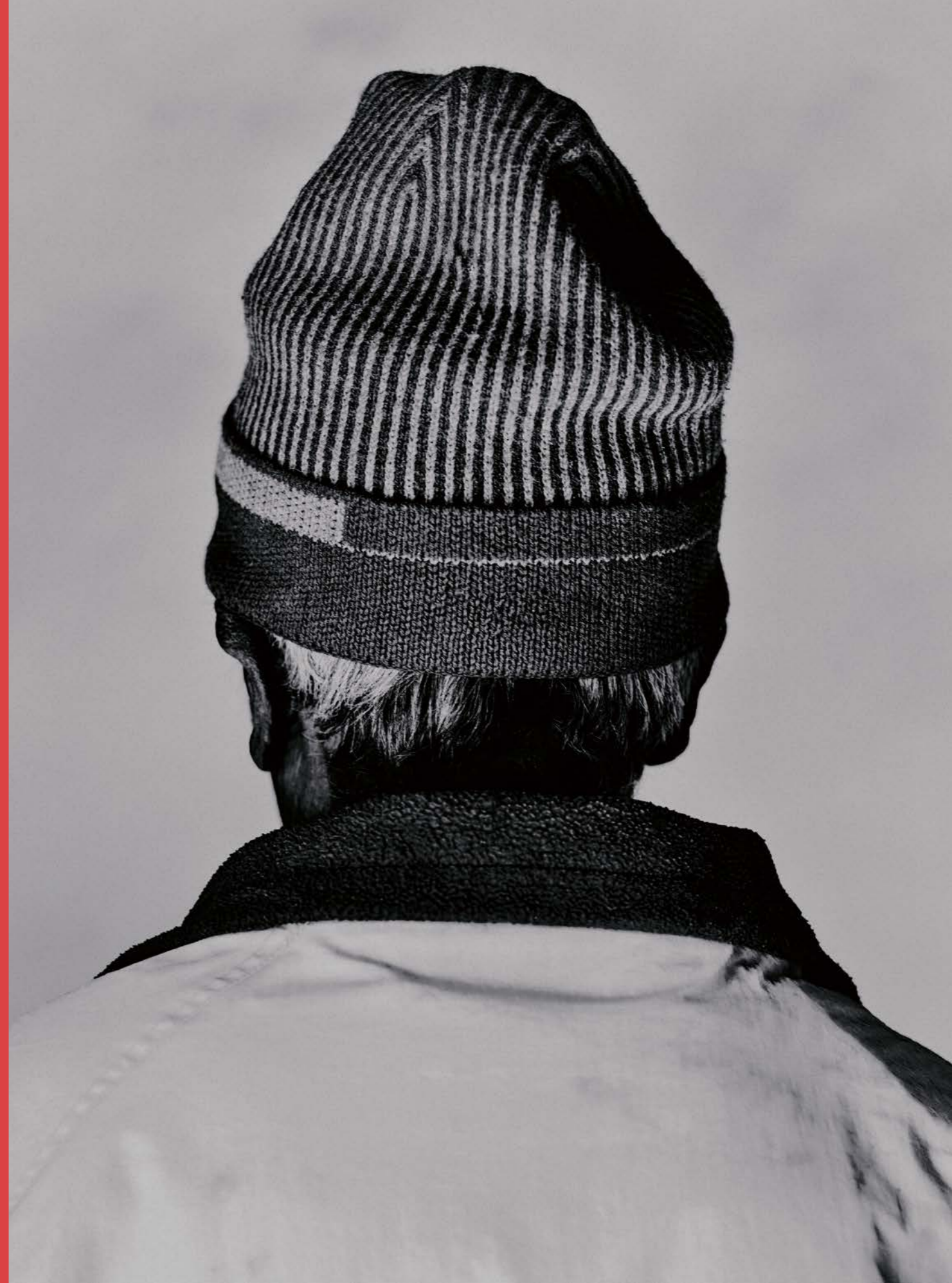
Crest, «Peak», 2019