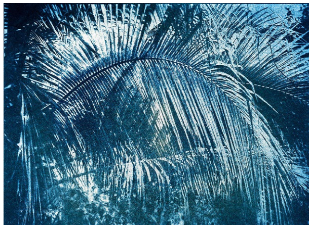
Douglas Mandry: «Kerriodoxa Elegans», 2014, 80 × 110 cm, Print, Ed. 2/3 + 2 AP, 3800 Franken.