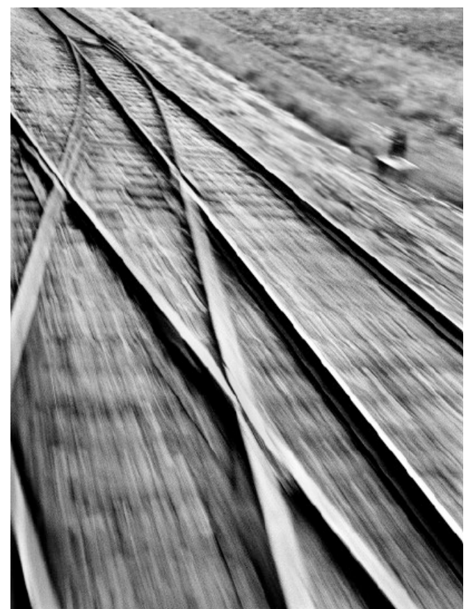
Die Maschine dröhnt, die Schienen flirren: «Alles war ein grosses Abenteuer.» Aus René Groebli's «Magie der Schiene».