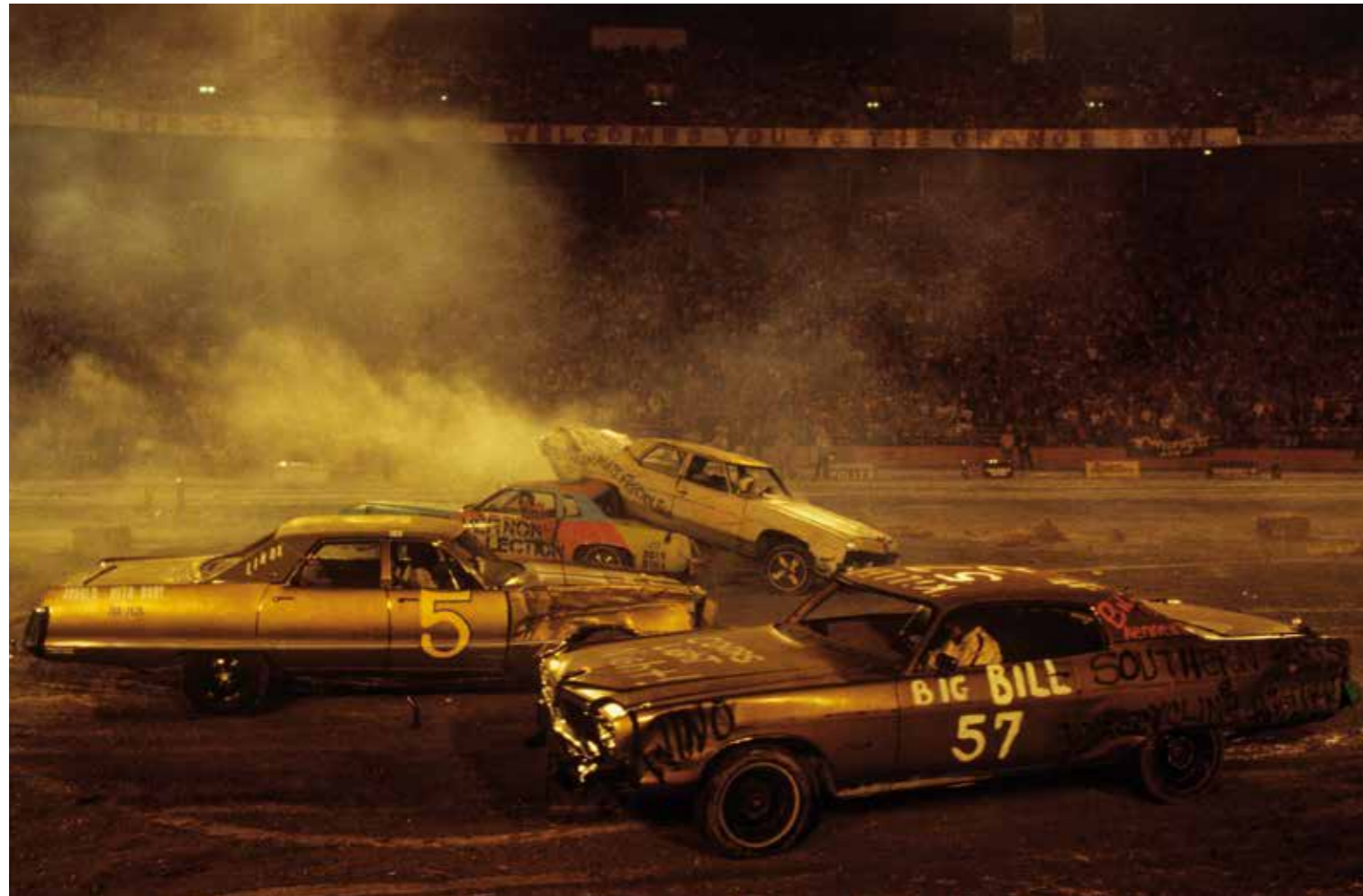
Car Rodeo, Burbank, LA, 1977 – 1985.