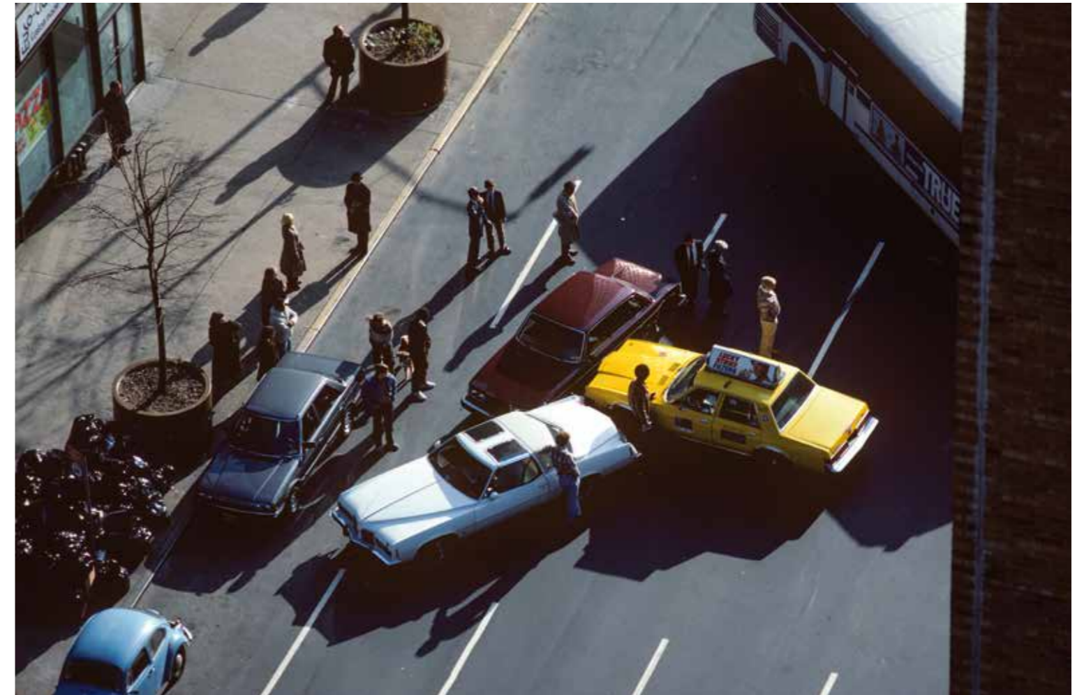
Accident on Broadway, NY, 1977 – 1985.