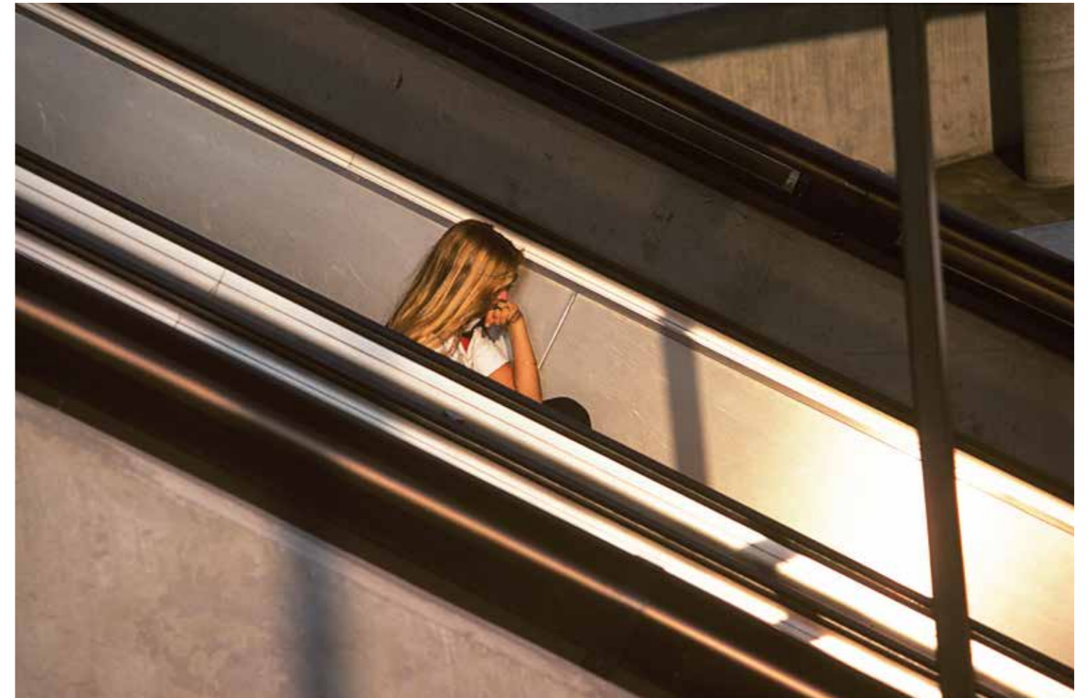
Woman on moving staircase, South Figueroa Street, LA, 1977 - 1985.