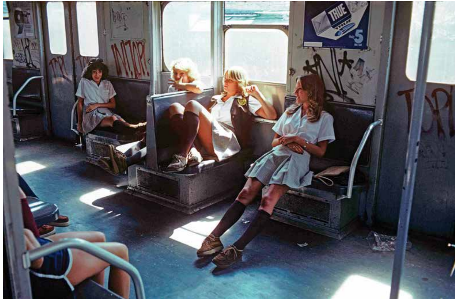
Schoolgirls on the train to Far Rockaway, Queens Subway NY, 1977 - 1985.